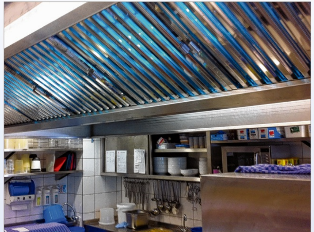
Die UV-Lampen werden hinter den Fettfiltern oder im Lüftungskanal der Abluftanlagen in gastronomischen Küchen installiert.

Eingesetzt werde das blaue Licht aus Leer beispielsweise in Restaurants, Hotelküchen, Imbissbetrieben, Großküchen und Kantinen und Sorge dabei für eine bessere Hygiene. Die UV-Lampen werden hinter den Fettfiltern oder im Lüftungskanal