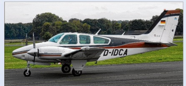
Durch den Aerozon-Air-Service kann das Leeraner Unternehmen schnell und flexibel reagieren.

„Für die Abfallwirtschaftsholding der Stadt Graz haben wir die UV-Lampe in einem